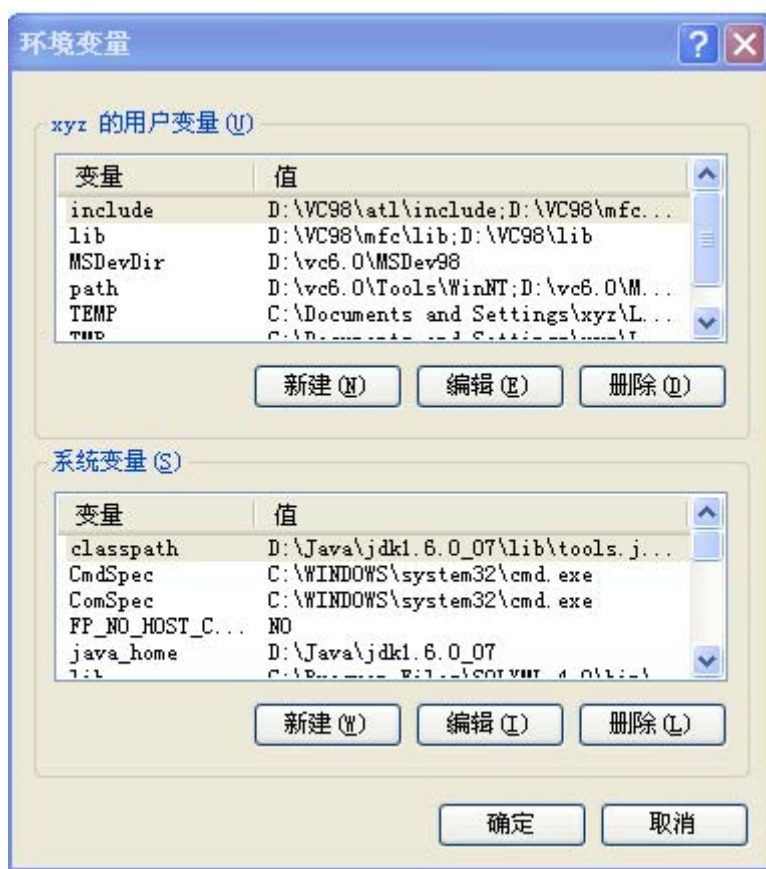
图 3-1 环境变量对话框图