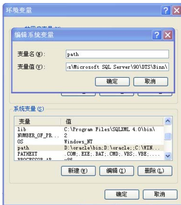
图 3-2 编辑环境变量对话框图

然后在变量值下输入 D:\Java\jdk1.6.0_07\bin (就是安装 java 文件件下 bin 文件件的路径), 然后点击确定。依次方法设置 classpath 的变量值为 D:\Java\jre1.6.0_07\lib\rt.jar; 变量 java_home 的值为 D:\Java\jdk1.6.0_07。